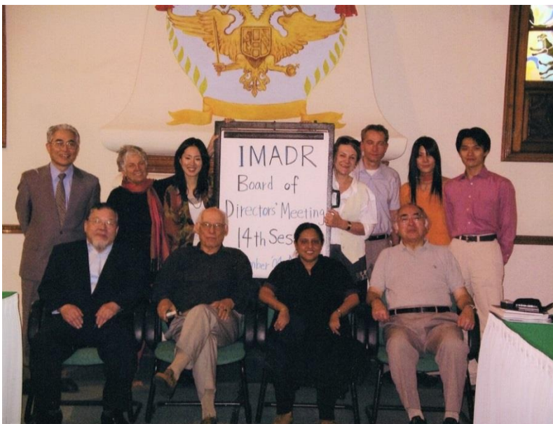
2004年IMADR理事会(メキシコにて) 前列左から2人目がロドルフォ・スターベンハーゲン教授