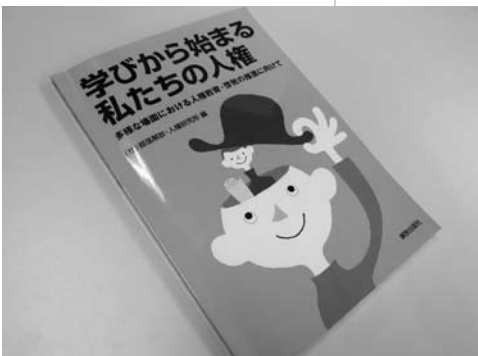
(3) 『学びから始まる私たちの人権—多様な場面における人権教育・啓発の推進に向けて』 2010年12月、部落解放・人権研究所編集発行、解放出版社発売。定価1,400円＋税。問い合わせ、06-6581-8636 部落解放・人権研究所まで。

すべての人が人権について学び、自己実現を遂げることができるようにすることが「世界プログラム」と「人権教育・啓発推進法」の最終的な目標です。それとともに、公務員や教員、警察官や刑務官などの人権との関わりが深い特定職業に従事する人びとは、人権尊重の責務を負っていること、従って人権研修をしっかりと受けるようにすることが両者のもう一つの重要な目標です。これらのことを、私たちは再確認し、今後それぞれの持ち場で、人権教育・啓発、人権研修に取り組んでいくことを誓い合うものです。